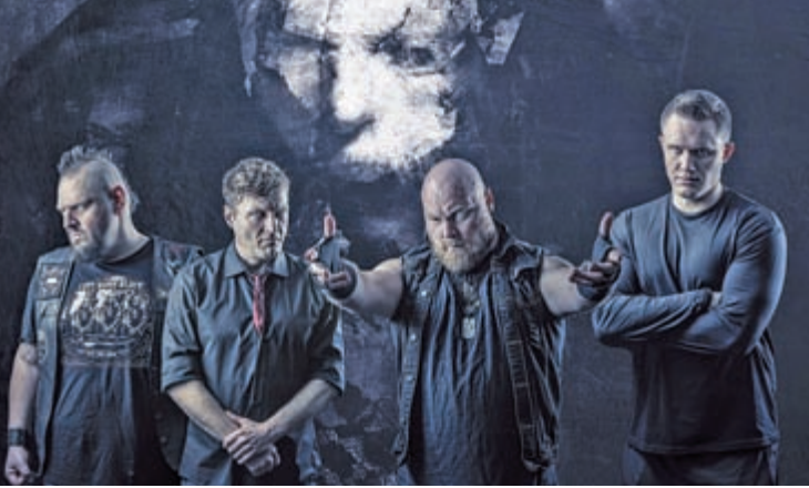
THE CRIMSON GHOSTS SUBKULTUR, 17.1.