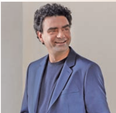
Herrenhausen Barock: Startenor Rolando Villazón kommt mit seinem Programm „Orfeo son io!“ zusammen mit dem preisgekrönten Ensemble L'Arpeggiata in die Galerie Herrenhausen .