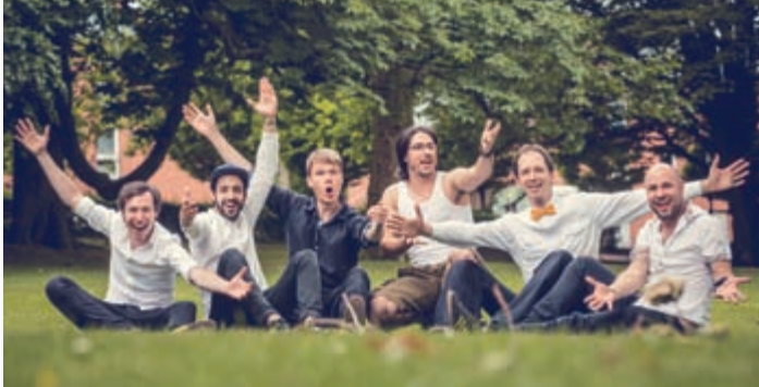
Die Bad Nenndorf Boys liefern den Song zur Landesgartenschau