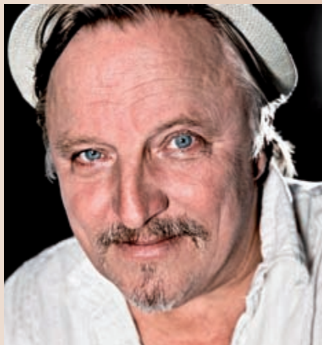
Authentisch und bodenständig: Axel Prahl will mehr sein als ein singender Schauspieler und bringt am 19.1. auch das neunköpfige Inselorchester mit in den Pavillon .