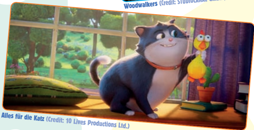
Alles für die Katz