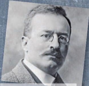
Forscherlegende Sven Hedin