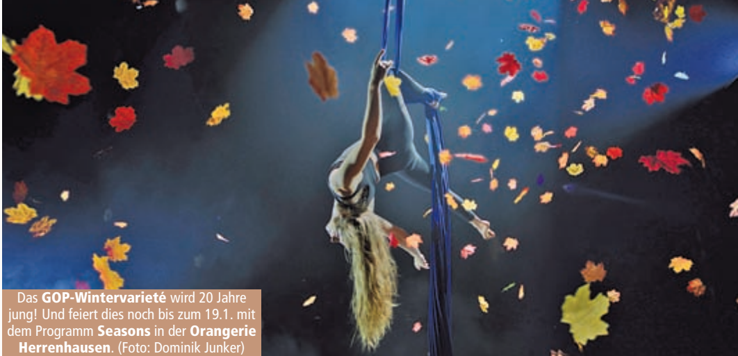
Das GOP-Wintervarieté wird 20 Jahre jung! Und feiert dies noch bis zum 19.1. mit dem Programm Seasons in der Orangerie Herrenhausen .