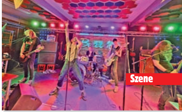
Sensationelle Show in der Beatbox: Motorblock