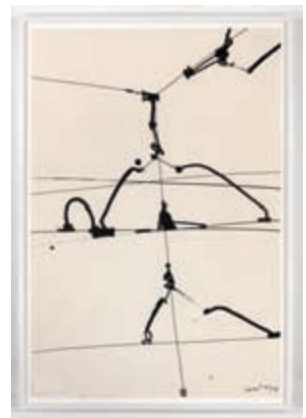
Im Kunstraum Friesenstraße werden Handzeichnungen aus der Sammlung Gisela Sperling erweitert um prominente Leihgaben gezeigt.